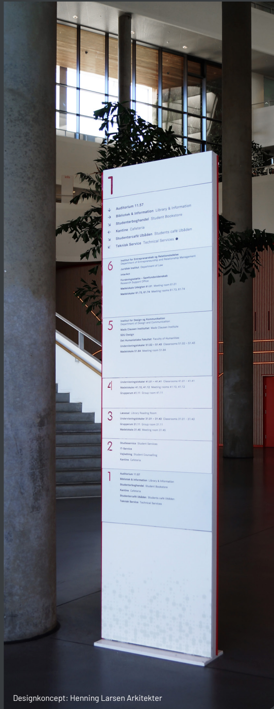
Designkoncept: Henning Larsen Arkitekter

Vi gør det nemt for jer. Vi er totalleverandør indenfor vores område og med vores rådgivning og ekspertise er I som kunde sikret den helt rette løsning for jer.