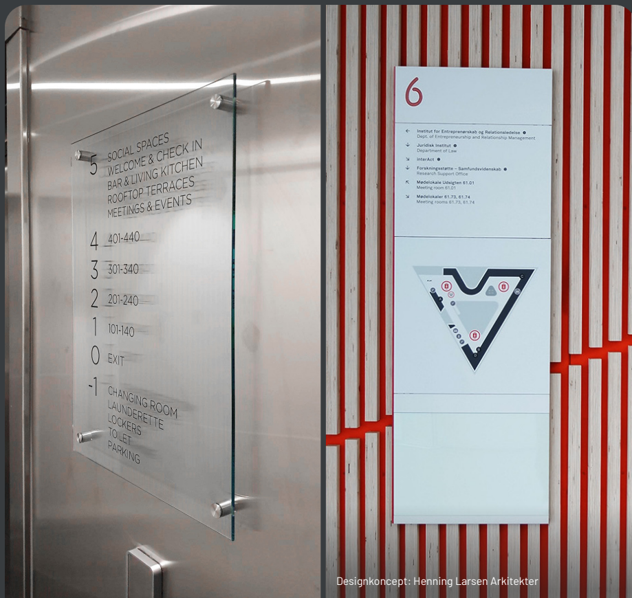
Designkoncept: Henning Larsen Arkitekter