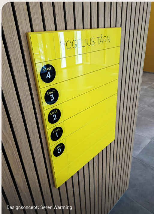
Designkoncept: Søren Warming