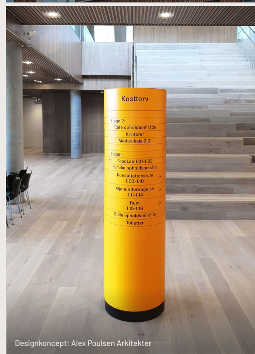
Designkoncept: Alex Poulsen Arkitekter